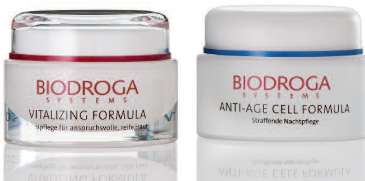
3 HELENA - inside finish - white-matt HELENA - outside finish - white-matt lacquered