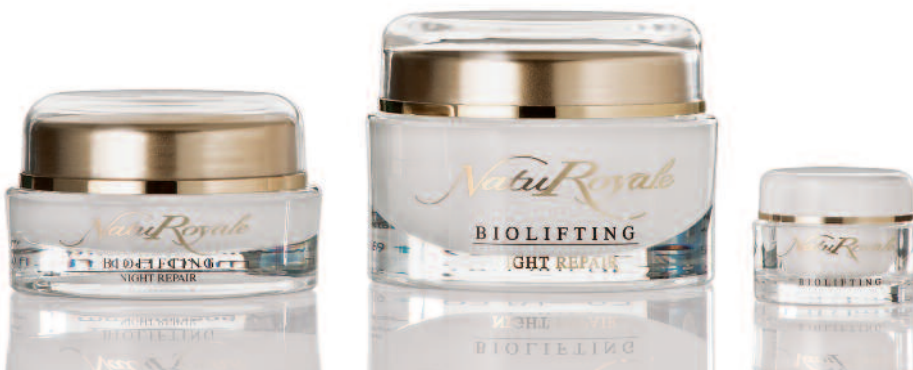
2 HELENA - inside finish - cap gold-matt lacquered, jar white matt