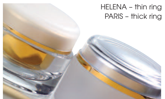
HELENA – thin ring PARIS – thick ring

Decoration: jar all-round screen printing/ hot foil stamping inner and outer cap screen printing/hot foil stamping, ring stamping