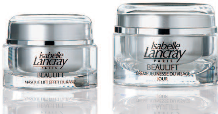
1 HELENA/PARIS - inside finish - silver-matt lacquered