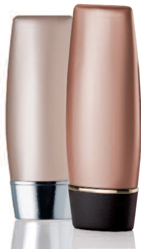
Athena Tottle 35 ml