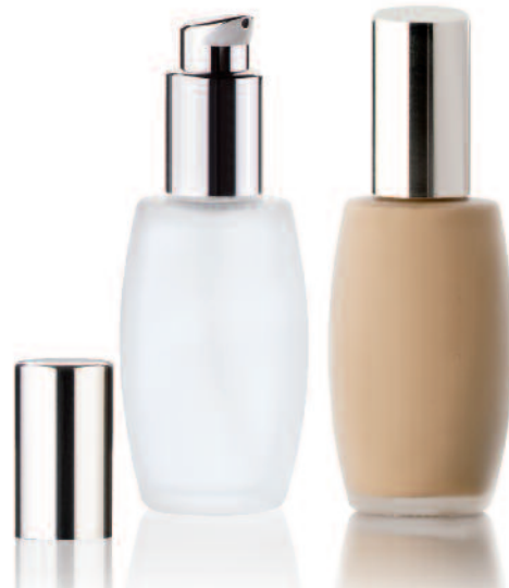
Athena Glass-Dispenser 30 ml