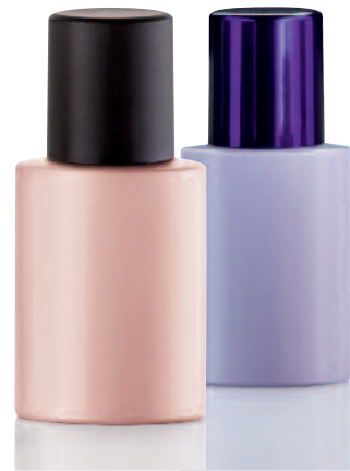
Elypse Bottle 30 ml