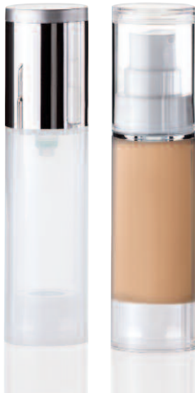
SEVERA Airless-Dispenser 30 ml