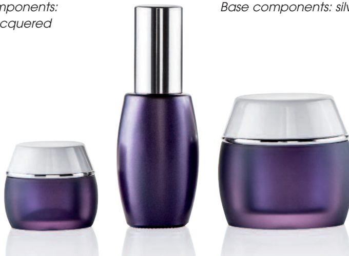
1 ATHENA lacquered

Caps: silver shiny metalized Ring stamping silver shiny Base components: silver shiny metalized