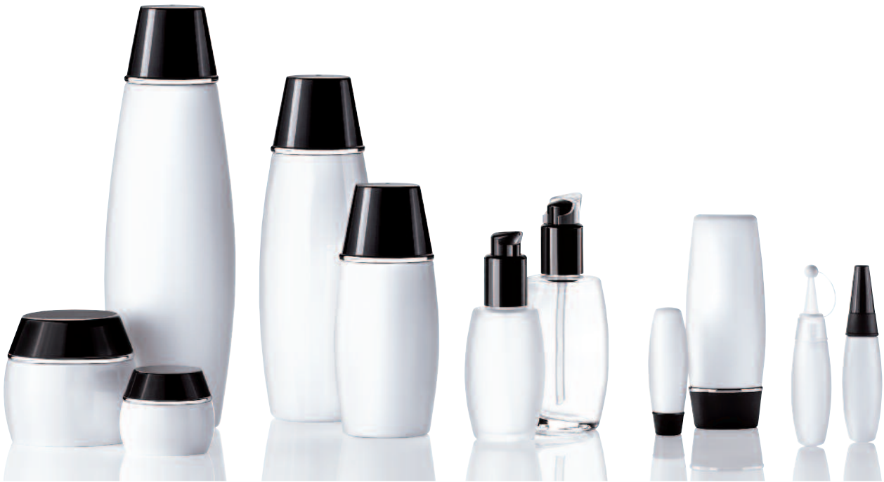
2 ATHENA black/white injection moulding