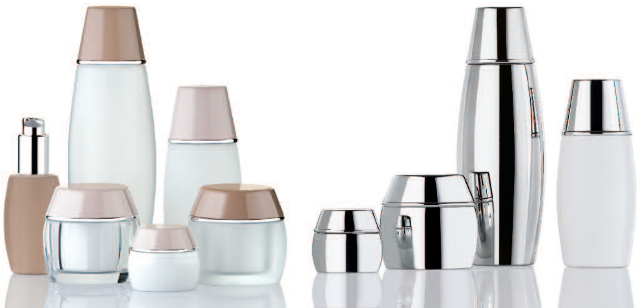
3 ATHENA brown/nude high-gloss-injection