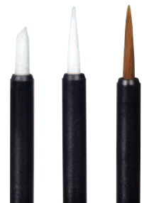
Block-Applicator Flex-Applicator Brush

Decoration: screen printing, hot foil stamping on the bottle and plastic cap