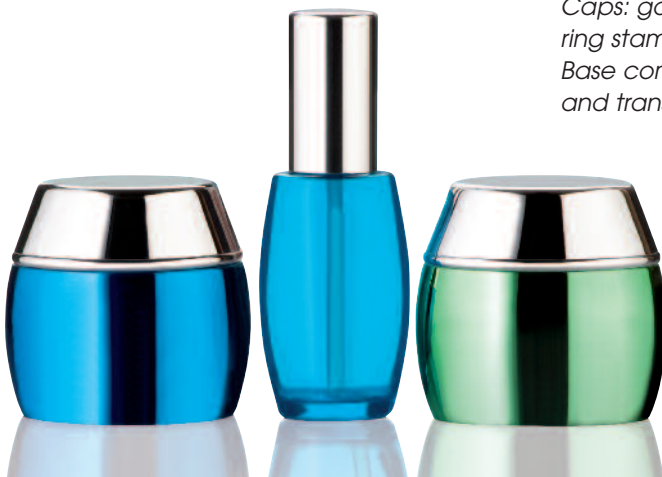
1 ATHENA metalized

Caps: gold matt two component finish, ring stamping gold shiny Base components: gold matt two component finish and transparent natural, clear