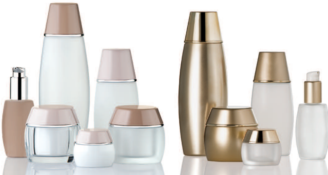
3 Athena brown/nude high-gloss-injection