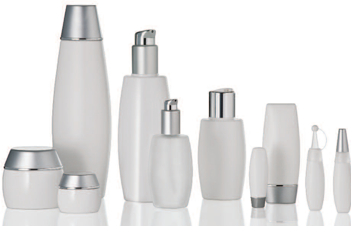
2 ATHENA silver-matt/white